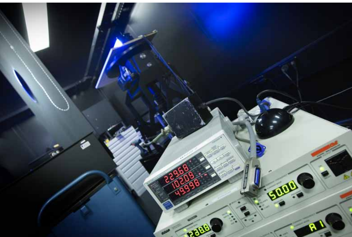
Meetopstelling in het VSL-laboratorium. Iets bov en het midden de rotatietafel waarop elk armatuur gemonteerd werd.